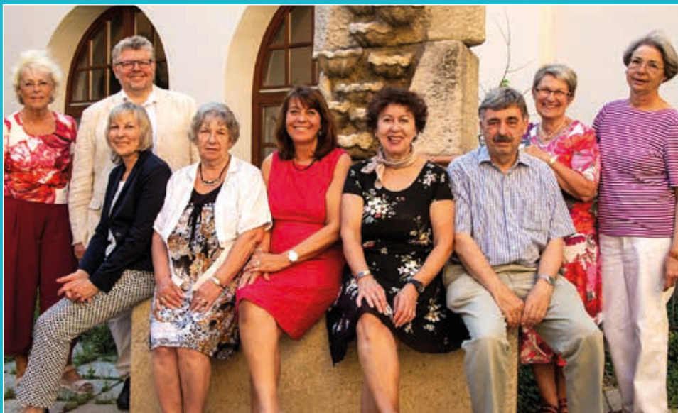
Stand: März 2021

Förderverein Freiwilligen-Zentrum Augsburg e.V. Mittlerer Lech 5 86150 Augsburg (Barrierefreier Zugang) Tel. 0821 4504220 Fax 0821 45042215 fv@freiwilligen-zentrum-augsburg.de www.freiwilligen-zentrum-augsburg.de